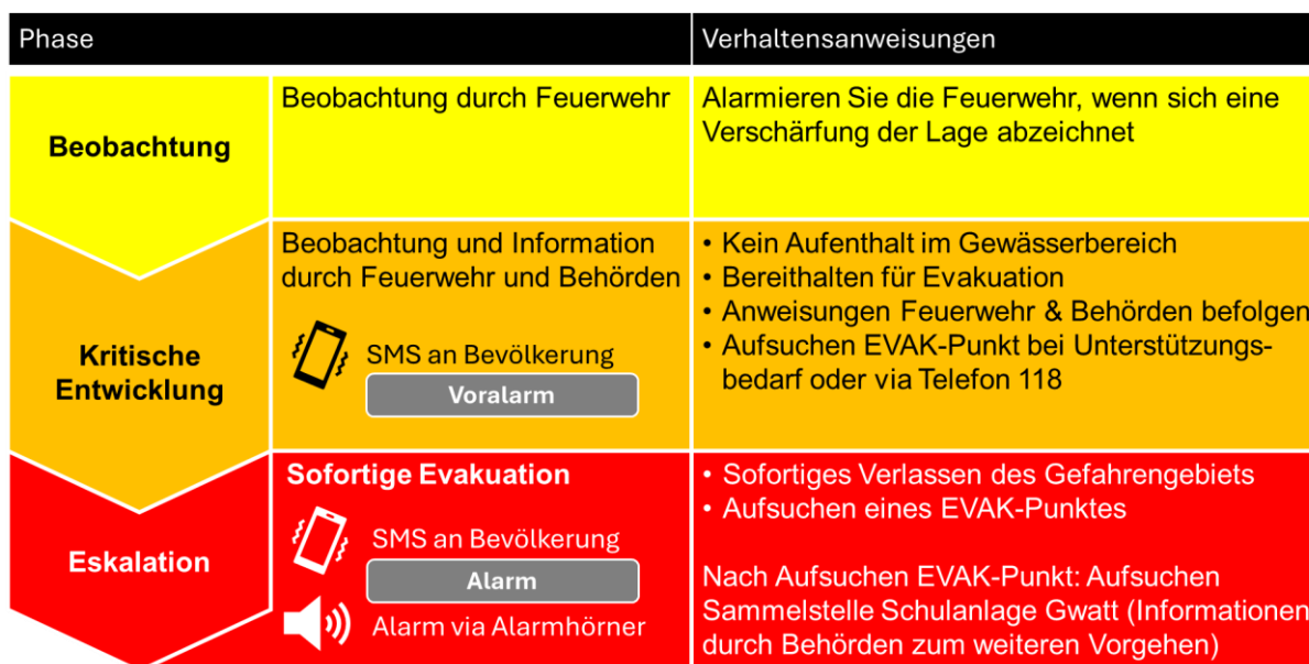
Schéma de la procédure

Comme vous le savez, le secteur de Mannried est exposé à un risque accru de coulées de boue et de crues le long du ruisseau de Mannried. Selon l'évolution de la situation, il peut donc être nécessaire d'évacuer temporairement la zone située le long du ruisseau de Mannried. La présente notice vous explique le déroulement d'une évacuation et vous indique les mesures de base à prendre afin de vous y préparer.